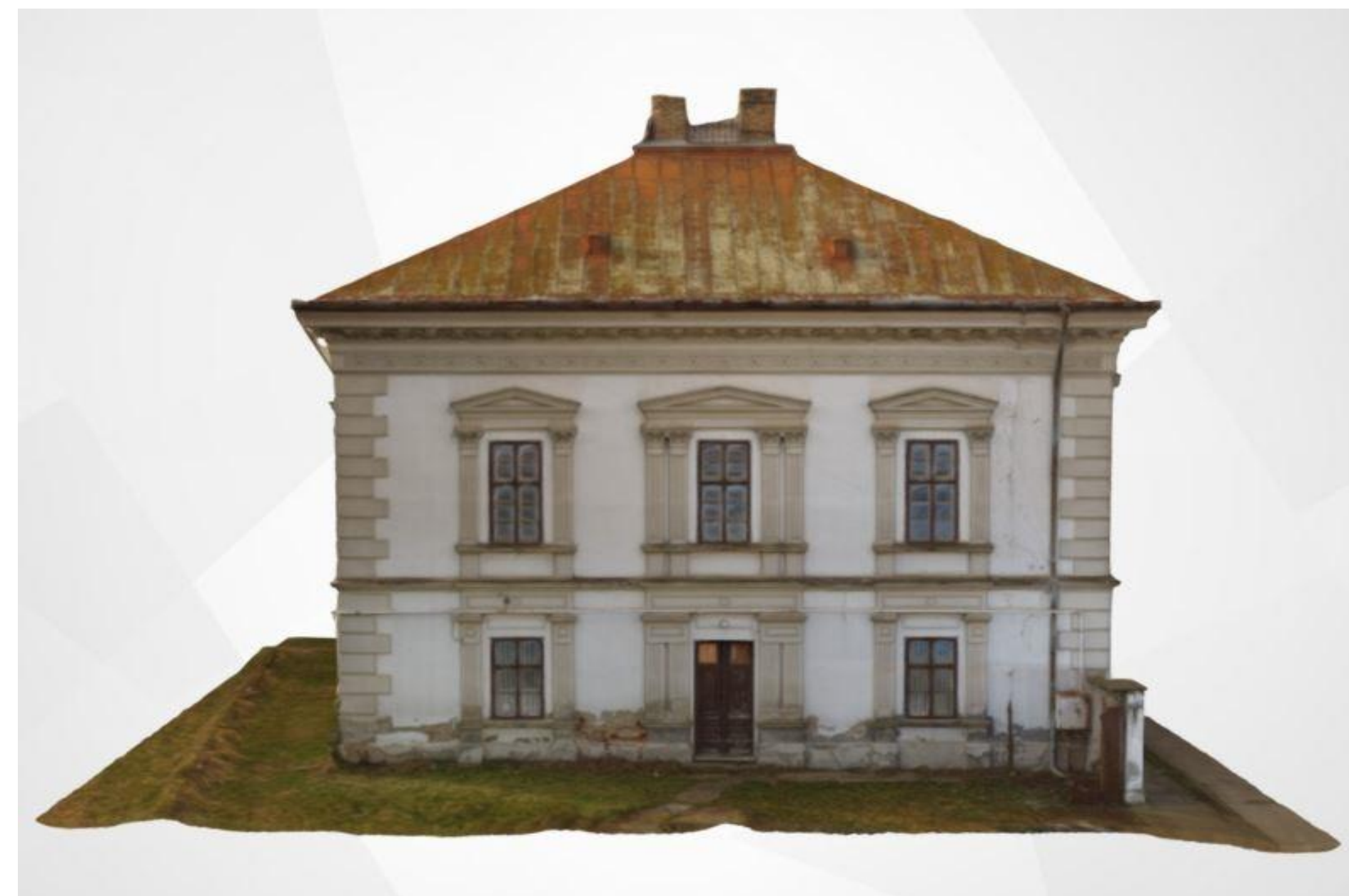
Meglévő keleti homlokzat