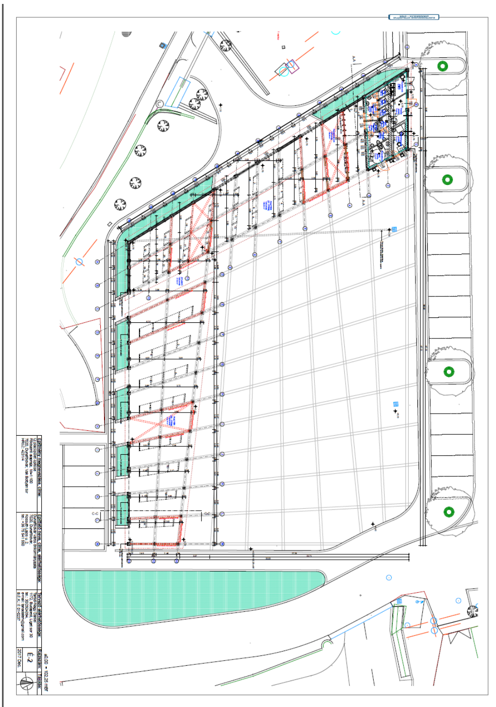
a) Piac térképe