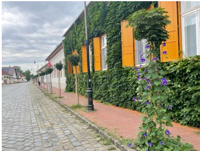
Templom u. fasor

2023. évben 10,5 millió Ft-ot biztosított a Templom u. fasor ültetésre.