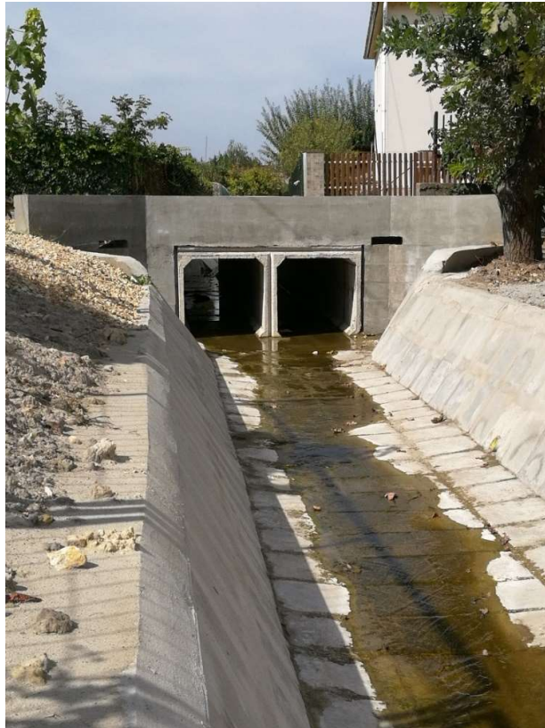
Kenderföldi árok vízrendezése

A fejlesztés keretében 1709 fm bel- és csapadékvíz védelmi létesítmény került kiépítésre.