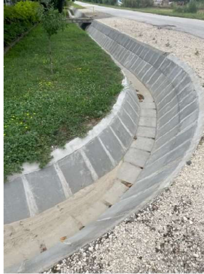
Györki sor csapadékvíz elvezetése

A város megoldandó vízvezetési problémái, ahol nagy esőzések alkalmával és utána vízkárok keletkezhetnek: