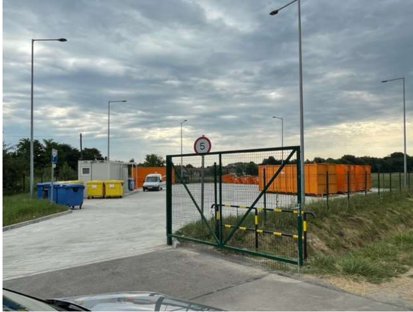
2023. júliusában megnyílt Hulladékudvar Dunaföldváron