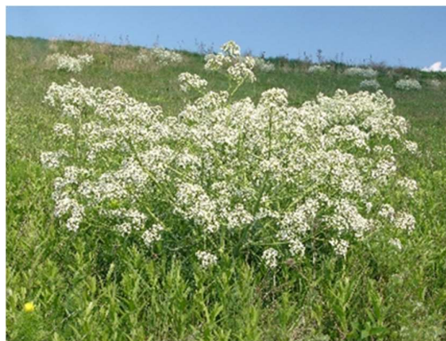
Tátorjános a Dél-Mezőföld Tájvédelmi Körzet területén