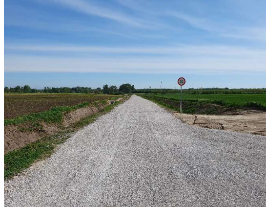
Kanacsi út szórt kőalappal