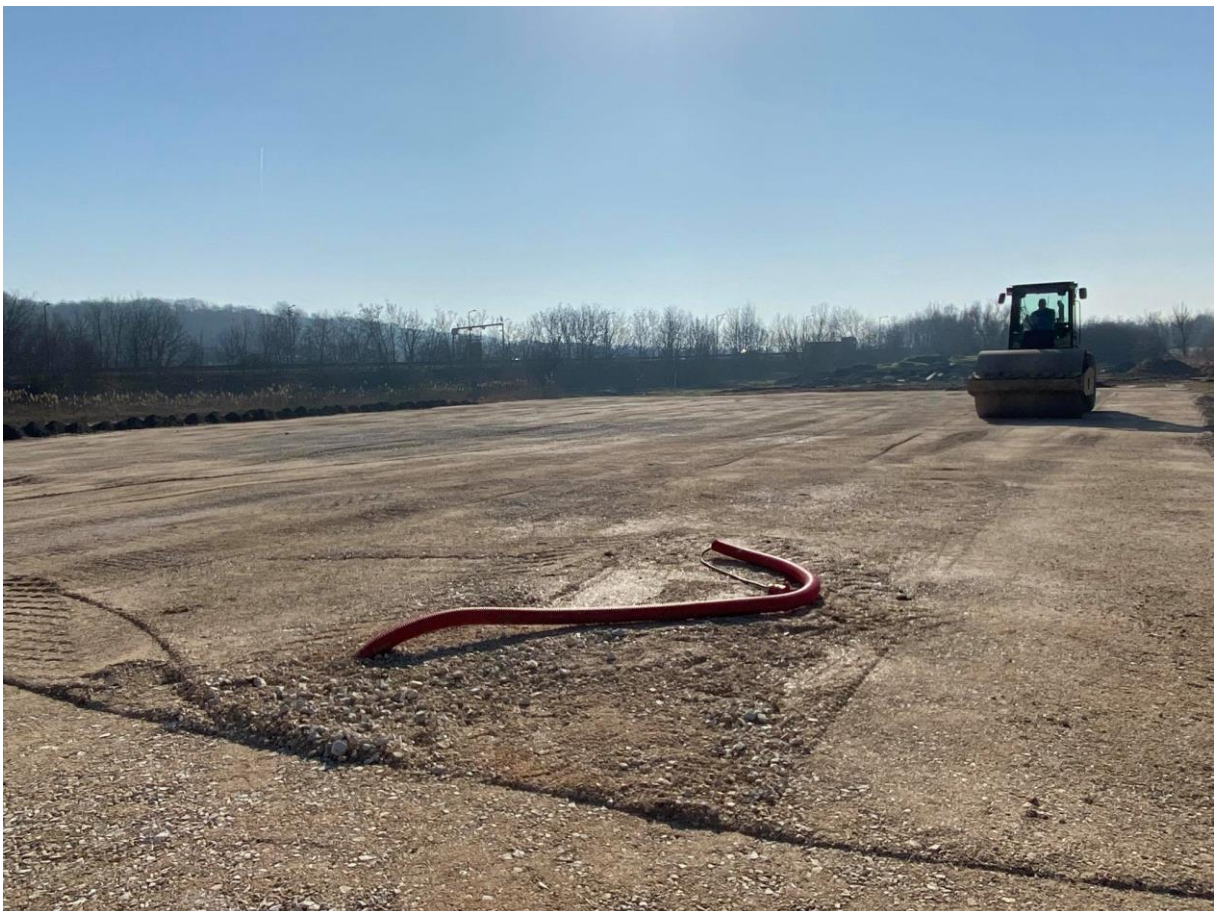
(a nulla szint)