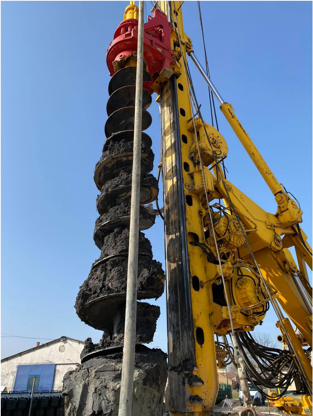
(a speciális fúró)

A közel 60 darab kútalapot összekötötték, így egy olyan masszív tartást kapott a csarnok, ami bármilyen magas talajvíz esetén is biztonságosan megtartja az épületet.