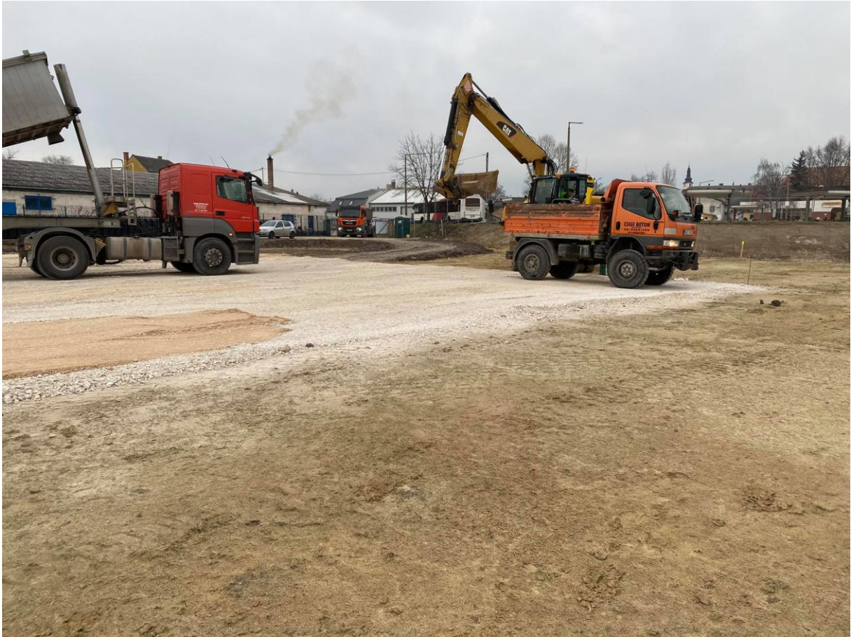
(a képen látható a rétegtrend)