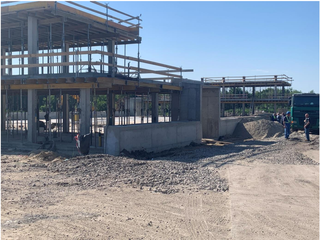
(a beton szerkezet)