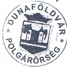
Hermanovszky Ferenc Egyesület elnöke