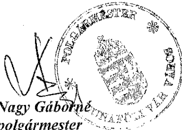
Nagy Gáborné polgármester Dunaföldvár Város Önkormányzata